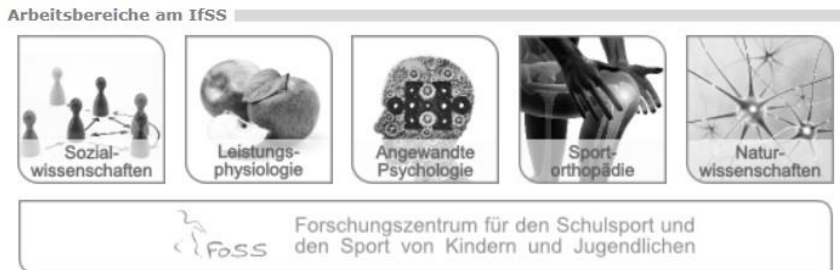
Abbildung 2: Arbeitsbereiche am IfSS (sport.kit.edu, 2015)

Bei Internetseiten als Körperschaftsautoren wird das „www.“ weggelassen, der Ländercode (z.B. „.com“, „.de“ oder „.edu“) ist jedoch Bestandteil einer eindeutigen Internetadresse und wird mit aufgeführt. Ist nicht bekannt, wann der Content veröffentlicht wurde, kann das Jahr durch „o.J.“ ersetzt werden (mehr dazu im Kapitel Literaturverzeichnis bei Internetquellen).